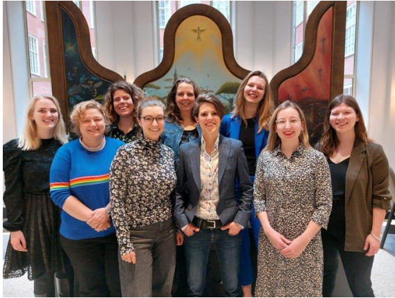
bijeenkomst vrouwen in de raad