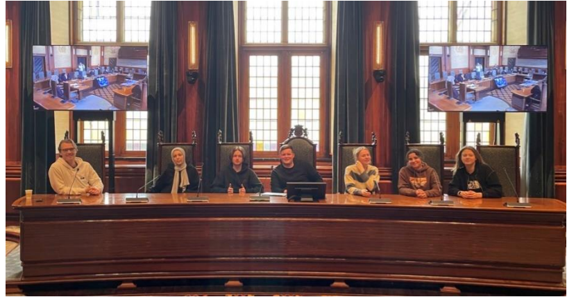
klassenbezoek MBO Rijnland