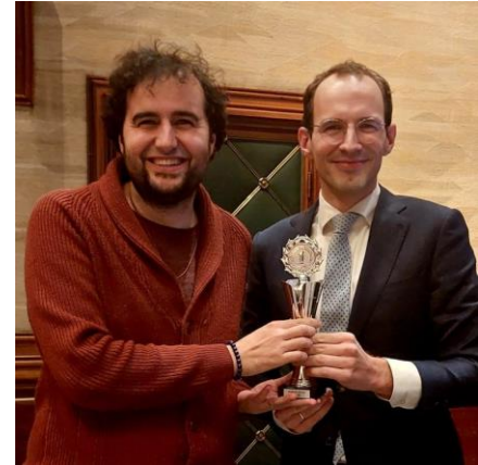
duidelijk verhaal bokaal